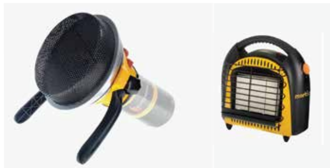
Exemples de chauffe-terrace